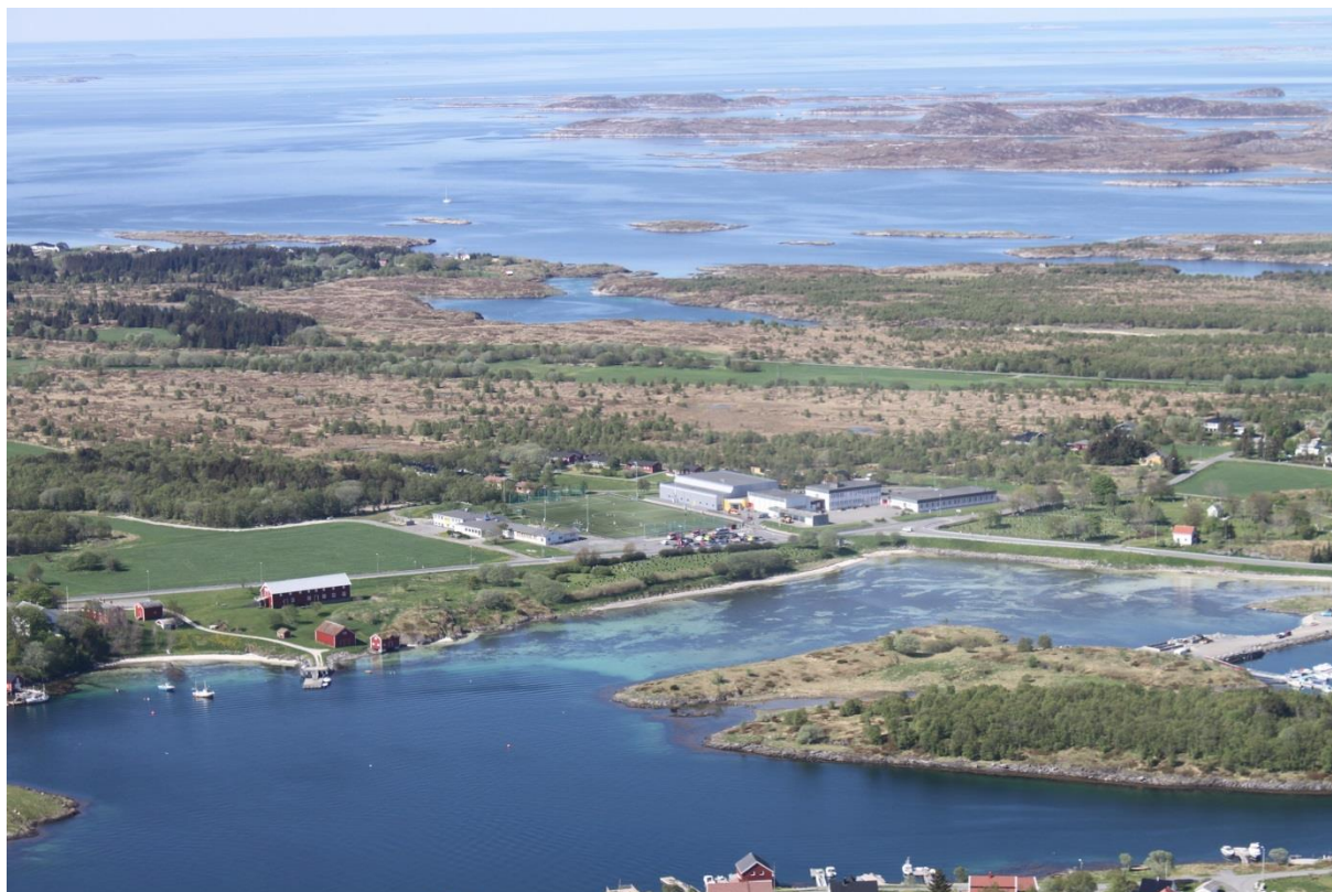
Herøy skole.