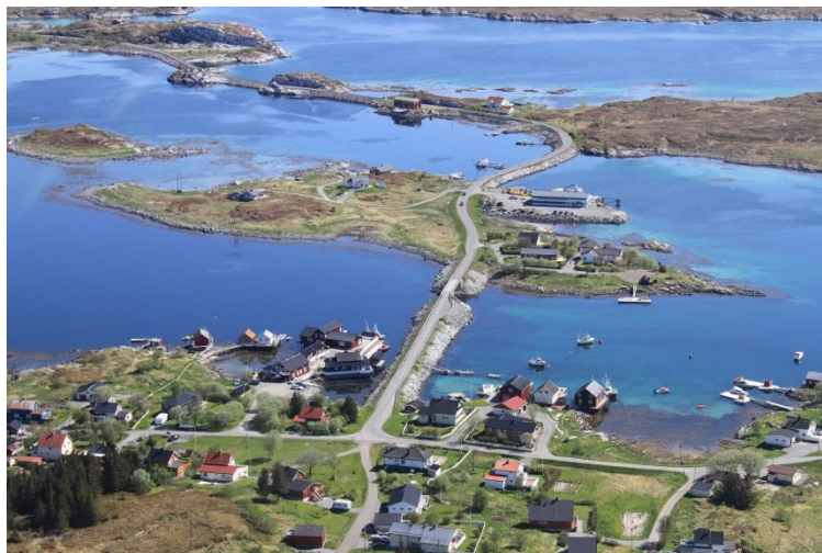
Seløy Kystferie AS, Seløy Sjøfarm AS og fiskere.

Vårt mål er å styrke og videreutvikle dagens næringsvirksomheter, samt å legge til rette for nyetablering og for gründere. Økt synliggjøring av de mulighetene som finnes i kommunen.