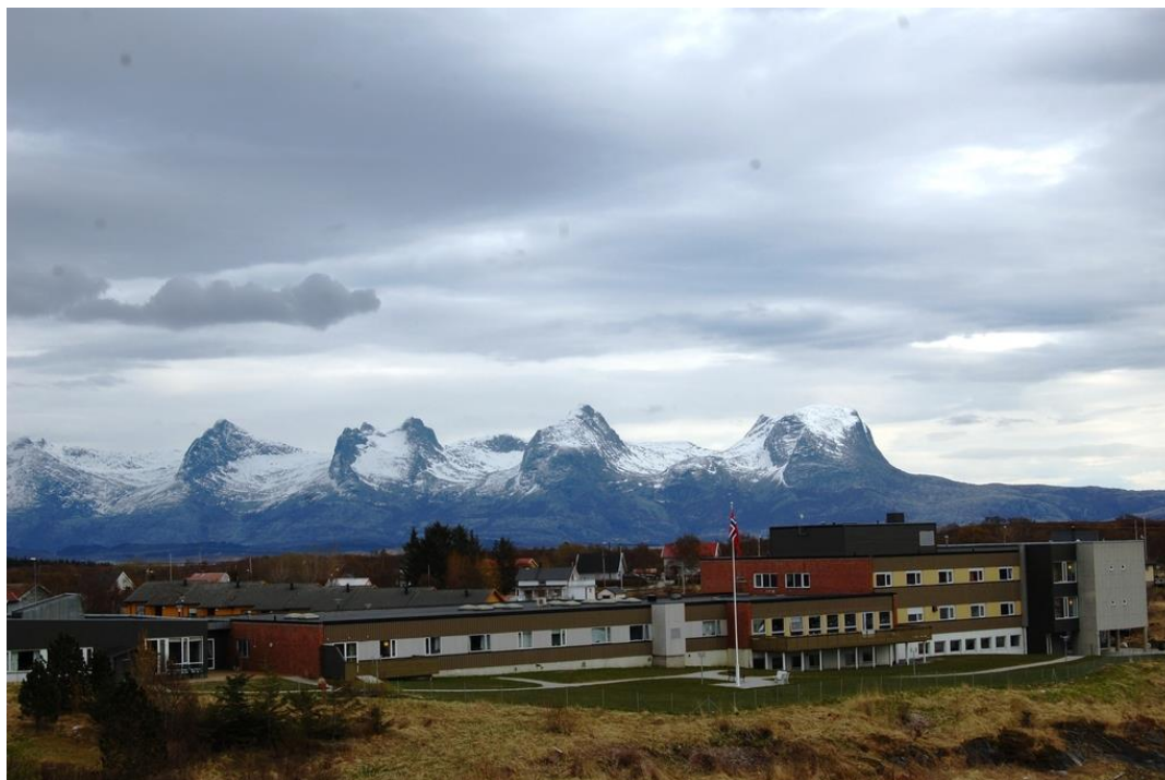
Herøy Sykehjem.