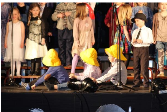
Herøy sine elever har kulturelle ferdigheter