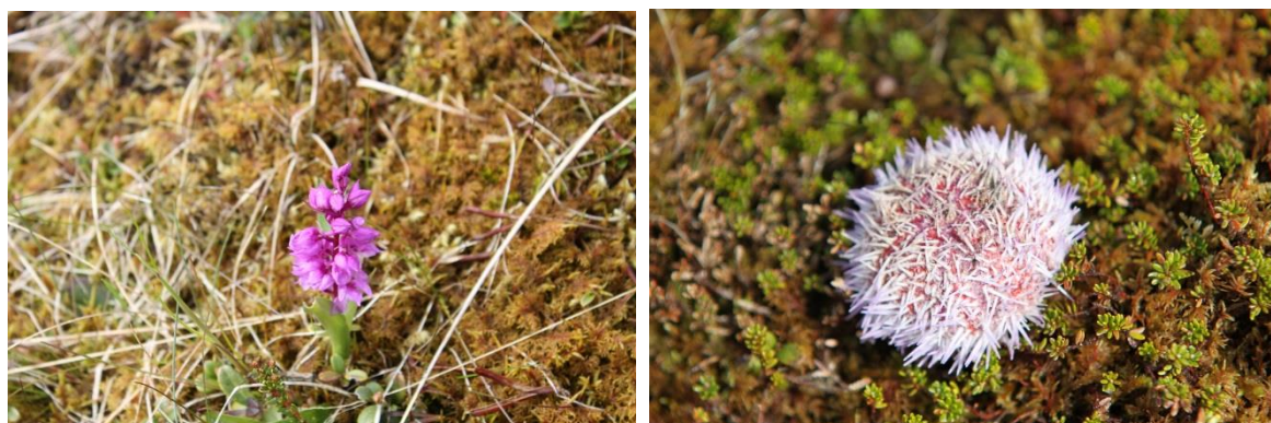
Plante og kråkebolle på Hestøya.