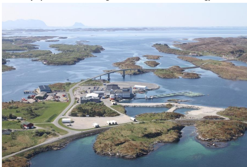
Herøy Marine Næringspark med flere.