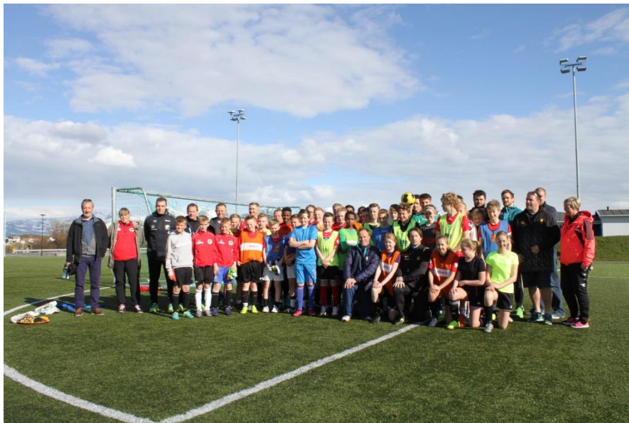
Herøy IL i treningsforum med Bodø Glimt trenere.

Frivillige organisasjoner skaper tilhørighet, integrasjon og samhold i nærmiljøet, der dugnadsånden er drivkraften. Disse er viktige partnere for å fremme gode og sunne tilbud innen lokal kultur, tradisjon og mangfold i folkehelsearbeid og næringsutvikling.