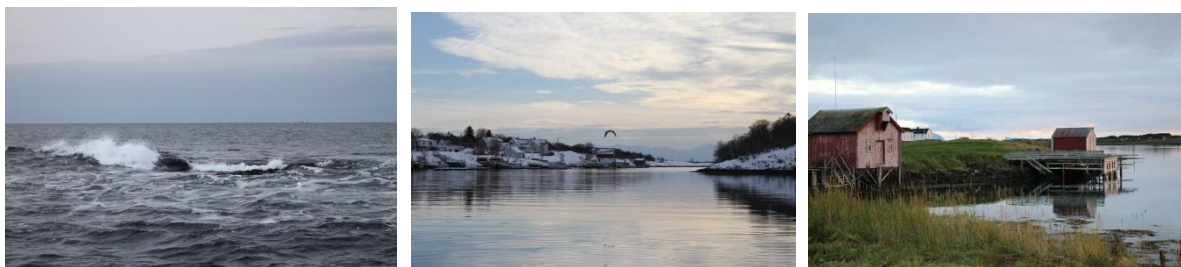
Kinnarøybåen, Herøysundet og Tennvalen mot Brasøy.