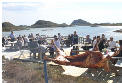
Øksningan nærmiljø.