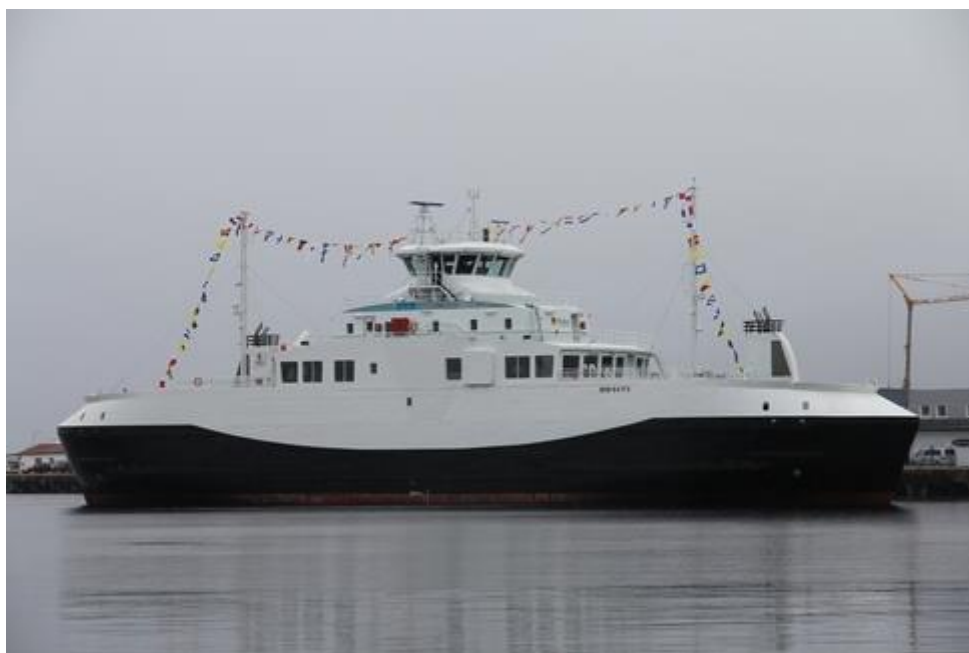
M/F Herøysund.